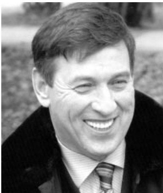
Виктор ФИРСОВ, мэр города Волгодонска

В XXI веке наш город в связи с пуском первого энергоблока Волгодонской АЭС сформировался как центр атомной энергетики на Юге России. А еще в 80-е годы здесь было построено уникальное предприятие атомного машиностроения "Атоммаш". В конце декабря прошлого года на втором блоке Волгодонской АЭС начаты этапы физического пуска реактора. Программа развития атомной отрасли страны предусматривает строительство и пуск энергоблоков 3 и 4. Собственно говоря, полномасштабное строительство третьего энергоблока уже началось, физический пуск его реактора намечен на 2013 год. Администрация города заинтересована в максимальном привлечении местных трудовых ресурсов для работы как на двух действующих энергоблоках, так и на новых, строящихся.