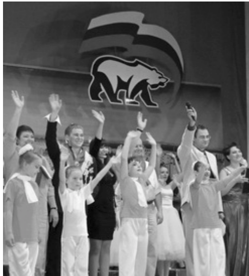
волгодонцам, завоевав особую популярность у жителей города.